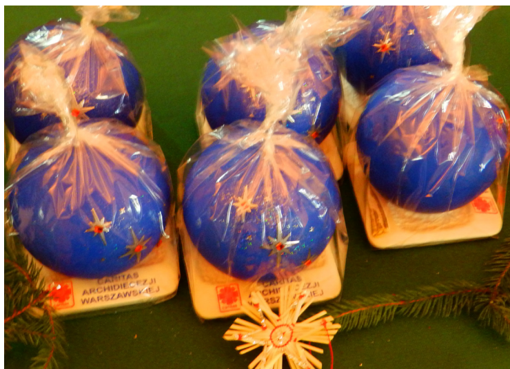
Co roku Caritas rozprowadza bożonarodzeniowe świece. Dochód z ich sprzedaży przeznaczony jest na działalność charytatywną.

W II Niedzielę Adwentu, 6 grudnia, w kawiarence parafialnej trwał kiermasz charytatywny. Na kilku stoiskach można było nabyć świece Caritas, opłatki, przeróżne książki a także ręcznie robione kartki bożonarodzeniowe oraz specjalne, parafialne bombki. Złaknieni słodczy mogli się pokrzepić ciastami i cukierkami. Kiermasz trwał od 8.30 do 14.00 oraz po przerwie obiadowej, od 17.30 do 20.00. Uzyskane kwoty zostały przeznaczone na paczki świąteczne dla dzieci i zorganizowanie wigilii dla osób potrzebujących. Akcji patronował Parafialny Zespół Caritas, a włączyły się do niego wszystkie wspólnoty działające przy parafii oraz Fundacja ks. Rumianka.