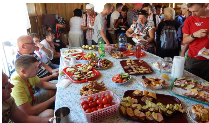
Posiłek w budującej się Parafii św. Maksymiliana w Korobczycach na Białorusi.