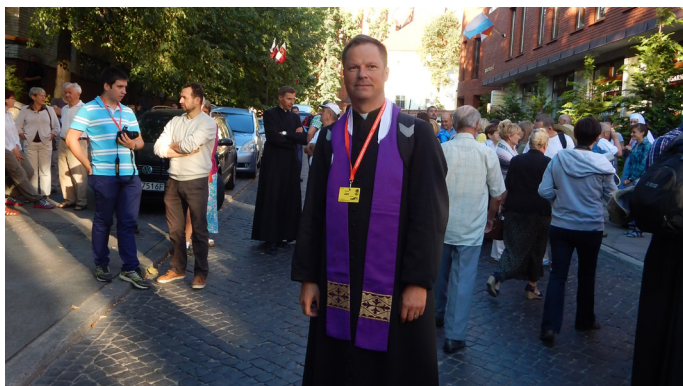
Wyjście pielgrzymki z katedry Białostockiej.

Gdy wyruszyliśmy z Białegostoku w dniu 16.08.2015r., było około 400 pielgrzymów. Po drodze dołączyła do nas spora grupa z Grodna na Białorusi (kilkadziesiąt osób). W ciągu 9 dni tj. od 16. do 24.08.2015 mieliśmy do przejścia około 300 kilometrów przez Polskę, Białoruś i Litwę. Gdy dowiedziałem się, że będzie w pielgrzymce zaledwie czterech księży do posługi duszpasterskiej, a właściwie