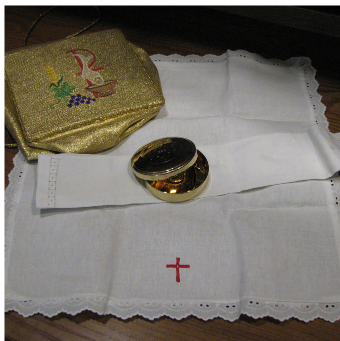
Bursa i leżące na korporale cyborium, w którym szafarz przenosi Komunię św.

Przed przyjściem szafarza w domu powinien być przygotowany stół: nakryty białym obrusem