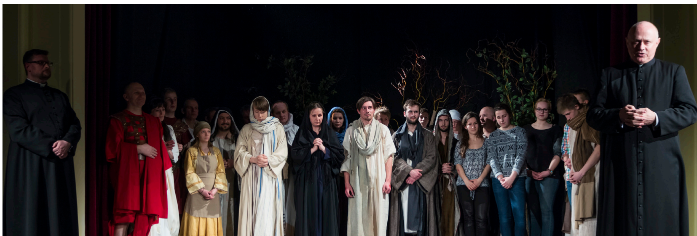
W zeszłym roku na Sali Teatralnej mogliśmy obejrzeć trzy przedstawienia - misterium pasyjne „Czas owocowania”, czytanie dramatu „Kościół w Chjochołowie”, oraz „Tylko miłość tworzy” meksykańską opowieść o św. Maksymilianie Kolbe.