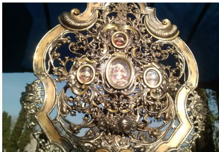
Wielki relikwiarz kryje w sobie szczątki m. in. św. Andrzeja Boboli.