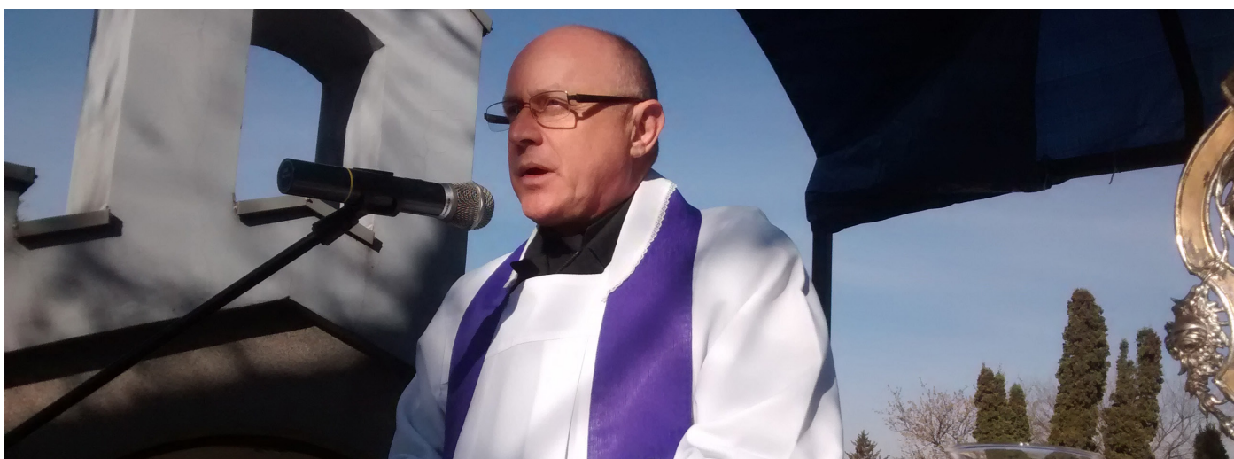
Ks. Proboszcz poprowadził procesję wspominkową.