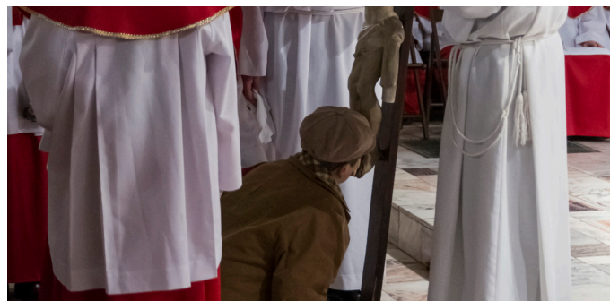
W każdy piątek Wielkiego Postu, po zakończeniu Drogi Krzyżowej, możemy adorować Krzyż, rozpamiętując Mękę Pańską. To nabożeństwo wzięło się z wielkopiątkowej Adoracji Krzyża.