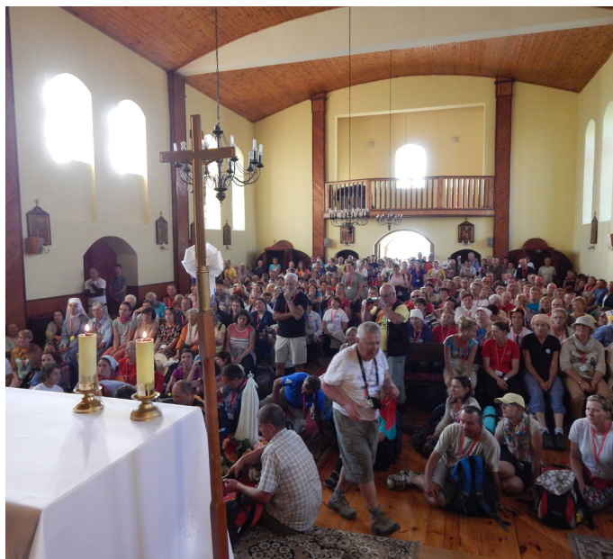
Msza św. w Jeziorach na Białorusi.

Obecna XXIII Ekumeniczna Pielgrzymka Piesza Białystok – Grodno – Wilno przebiegała pod hasłem „Budujemy na skale”. Temu też tematowi poświęcony był cykl konferencji, których codziennie słuchaliśmy. Jakże ten temat jest dziś aktualny nie muszą chyba nikomu przypominać, gdy tyle małżeństw i rodzin rozpada się lub przeżywa kryzysy a największymi ich ofiarami są cierpiące z tego powodu dzieci. „Każdego więc kto tych słów słucha i wypełnia je, można porównać z człowiekiem roztropnym, który dom swój zbudował na skale. Spadł deszcz, wezbrały rzeki, zerwały się wichry i uderzyły w ten dom. On jednak nie runął, bo na skale był utwierdzony” (Mt 7, 24-25). „Tym którzy mają przekroczyć próg trzeciego tysiąclecia pragniemy powiedzieć: Budujcie dom na skale! Budujcie dom waszego życia osobistego i społecznego na skale, a skałą jest Chrystus – Chrystus żyjący w swym Kościele!” (Jan Paweł II, Pelplin, 6 czerwca 1999r.) Te słowa Ojca Świętego nie straciły dziś nic ze swojej aktualności.