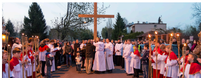
Procesja Drogi Krzyżowej ulicami naszej parafii na stałe weszła do naszej tradycji wielkopostnej.

Szczególnym dniem postnym jest Środa Popielcowa, kiedy to obowiązuje wstrzemięźliwość od pokarmów mięsnych i post ścisły (trzy posiłki w ciągu dnia, w tym tylko jeden - do syta). Prawem o wstrzemięźliwości są związani wszyscy powyżej 14. roku życia, a prawem o poście - osoby pełnoletnie do rozpoczęcia 60. roku życia. Pamiętając o tradycyjnym poście piątkowym warto dodać do tej „oficjalnej” ascezy, jaką proponuje Kościół, jakieś własne, choćby najdrobniejsze umartwienie.