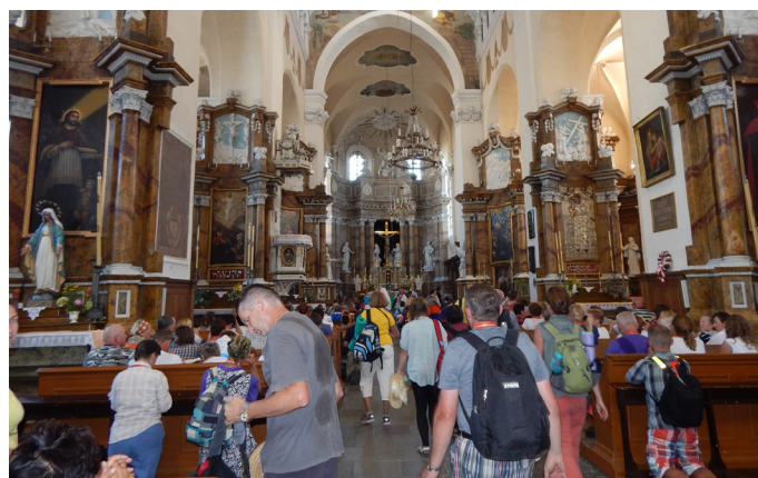
W kościele seminaryjnym w Grodnie.