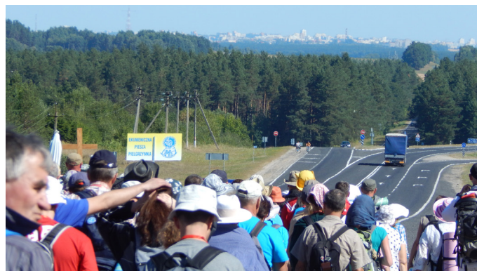
Przekroczenie granicy Polsko-Białoruskiej.