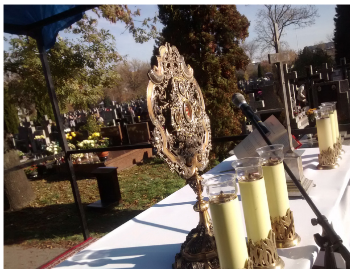
Relikwie świętych zostały też wystawione na ołtarzu podczas liturgii na parafialnym cmentarzu.