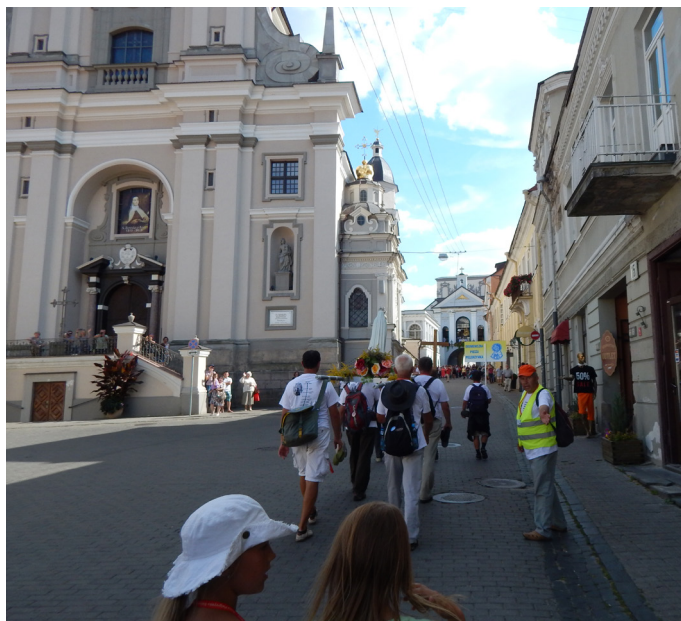
Wejście do Ostrej Bramy w Wilnie.