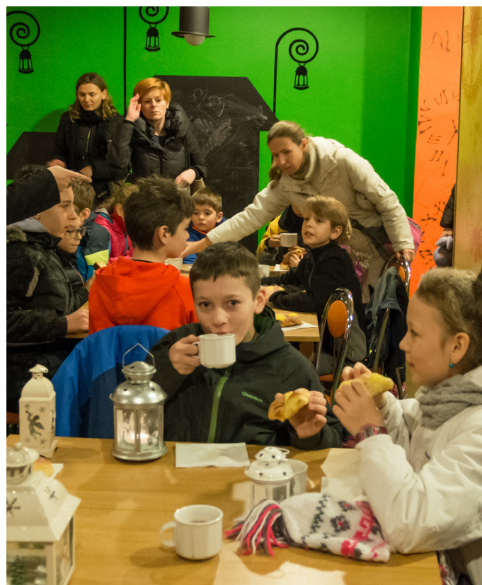
Uczestników Rorat, a co za tym idzie, także i śniadań w kawiarence przybywa z roku na rok.